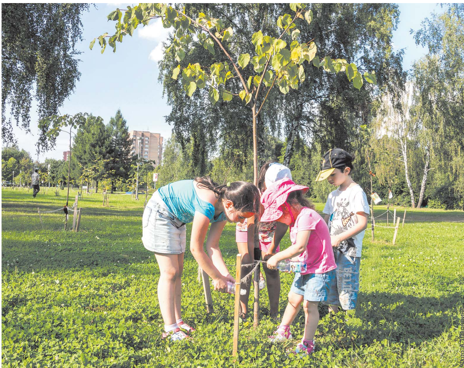
Дети ухаживают за липами, посаженными весной на мемориале Славы

17 СЕНТЯБРЯ ВСЕ НЕРАВНОДУШНЫЕ ЖИТЕЛИ ПОДМОСКОВЬЯ СМОГУТ ПОСАДИТЬ ДЕРЕВЬЯ НА 111 ПЛОЩАДКАХ. В АКЦИИ ПЛАНИРУЕТСЯ УЧАСТИЕ БОЛЕЕ 160 ТЫС. ЧЕЛОВЕК. 1 МЛН 300 ТЫС. ДЕРЕВЬЕВ БУДЕТ ПОСАЖЕНО НА ЗЕМЛЯХ ЛЕСНОГО ФОНДА И ОКОЛО 110 ТЫС. – В МУНИЦИПАЛИТЕТАХ РЕГИОНА.