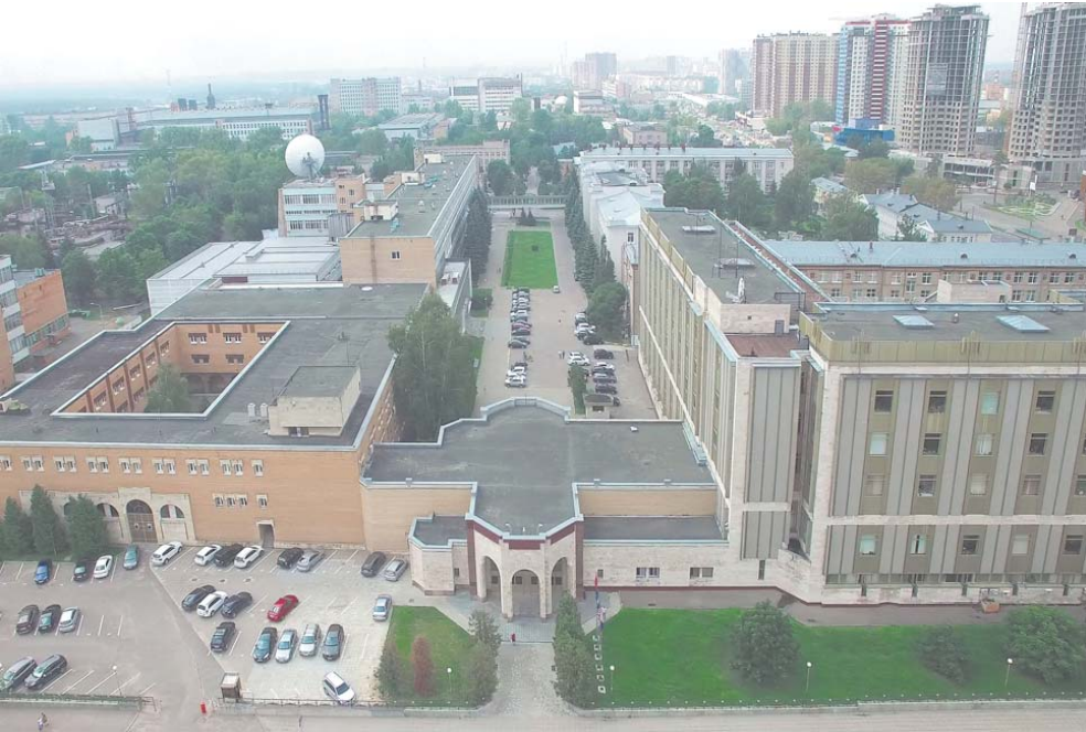
ЦНИИмаш – предприятие с 70-летней историей и богатыми традициями

– А некоторые говорят, что профкомы занимаются только распределением путёвок... – Слово «профсоюз» обычно ассоциируется с оказанием материальной помощи, распределением путёвок и организацией культурно-массовой работы. Всем этим профсоюз действительно занимается. И наши права закреплены в Трудовом кодексе РФ, в законах «О профессиональных союзах, их правах и гарантиях деятельности», «О коллективных договорах и соглашениях», «Об основах охраны труда в РФ» и других. За годы существования профсоюза какие только проблемы ни приходилось решать нашей организации! Даже такие, как обеспечение сотрудников предприятия дровами – в архиве хранится и такой документ. Однако главная задача профсоюза – представлять интересы членов организации и защищать их социально-трудовые права. Профком – связующее звено между администрацией и коллективом, которому