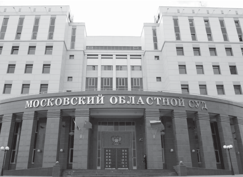
Здание Московского областного суда