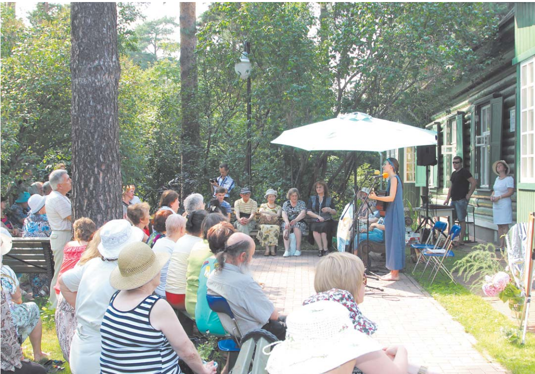
30 июля в Мемориальном доме-музее Марины Цветаевой в Болшеве было очень многолюдно