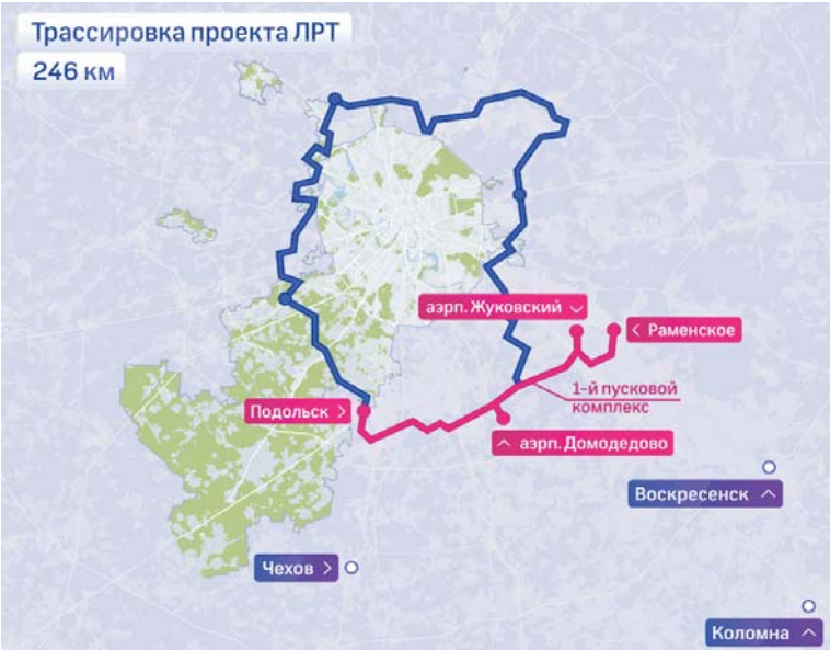
Легкорельсовый транспорт сделает более удобным передвижение по Подмосковью

Первый пусковой комплекс пройдёт от Подольска через До-