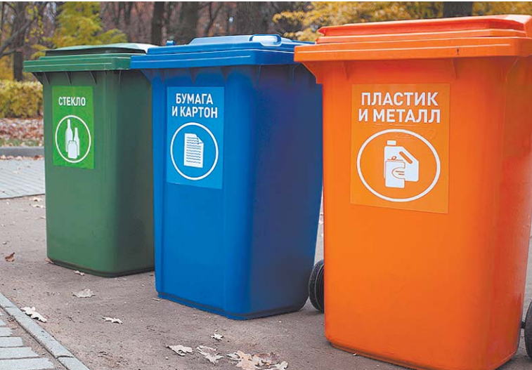
В скором времени в Подмосковье будет внедрена новая система утилизации бытовых отходов.

В скором времени в Подмосковье будет внедрена новая система утилизации бытовых отходов. – Из 39 полигонов мы закрыли 16, за следующие три года мы закроем ещё девять, – уточнил Воробьёв. – Наша задача – переориентироваться и в ближайшие годы перейти к более совершенному способу утилизации мусора, который предполагает сортировку и сжигание. Первый шаг на пути к выполнению поставленной губернатором задачи – введение в Московской области раздельного сбора мусора. С 1 января 2017 года раздельный сбор станет обяза-