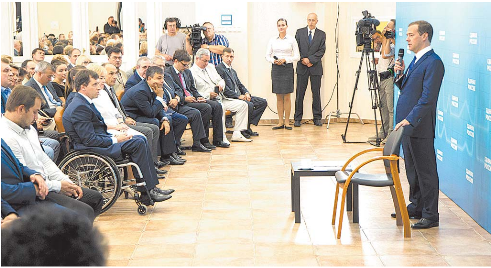
На встрече обсудили проблемы здравоохранения