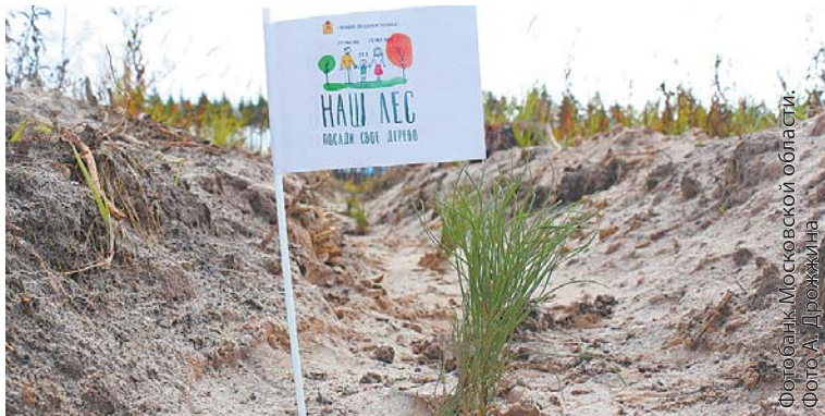
С 2013 года в рамках акций посажено более 6 млн деревьев. Сеянцы хорошо приживаются

рубки планируется завершить, а в 2020 году будет полностью выполнена программа по лесовосстановлению. Акция «Наш лес. Посади своё дерево» пройдёт во всём Подмосковье 17 сентября, накануне Дня работника леса. С 10 до 13 часов все желающие смогут принять участие в посадке деревьев. Уже определены 111 площадок на 334 гектарах лесного фонда. 10 августа завершится подбор площа-